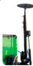
Jeu de traceurs hydrauliques