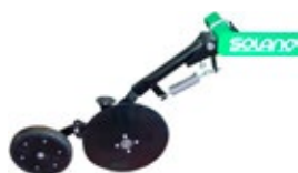
Roues de rappuie (seulement pour modèle VERSEM à disques TD). Prix unitaire: