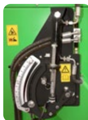
Coupure hydraulique de semis (seulement pour modèles SA)