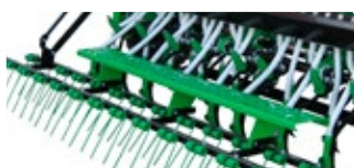
Marche-pied (sseulement pour modèles SV)