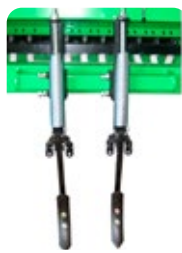
Jeu effaceurs de traces à ressort