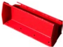
Pièce de réduction de la largeur d'ouverture du vibreur de la RT65 MIX