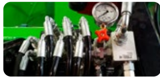
Kit de régulation de la pression de serrage du vibreur RT 65 MIX