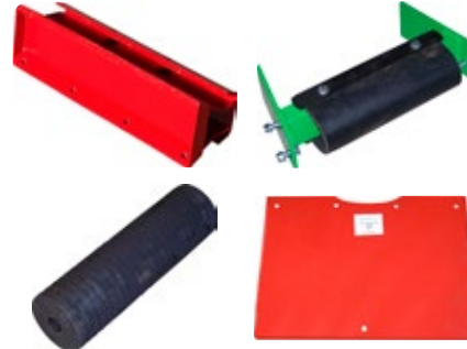
Kit arbres jeunes pour récolteuse RT65 MIX