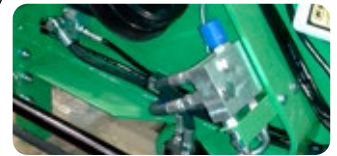
Kit de régulation de débit pour les vis sans fin de déchargement RT 65 *uniquement pour tracteur avec débit d'huile supérieur à 60 L/mn sans possibilité de régulation