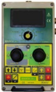
Différence de prix pour boîtier control Mix avec potentiomètre : › Amandes : régulation en cabine de la vitesse de travail des écaleuses. › Olives : régulation de vibration additionnelle.