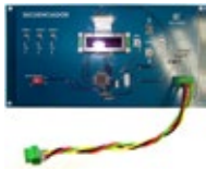
Séquences de travail automatiques