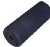
Montage de coussins souples sur RT65 MIX (en remplacement des coussins standards)