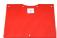
Montage de bavettes tendres sur RT65 MIX (en remplacement des bavettes standards)