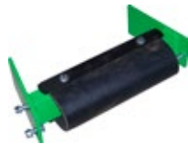
Pièce d'avancée de butée de troncs sur récolteuse RT65 MIX