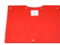
Montage de bavettes tendres sur RT 65 (en remplacement des bavettes standards)