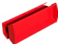
Pièce de réduction de la largeur d'ouverture du vibreur de la RT 65