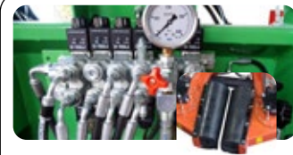
Kit de régulation de la pression de serrage du vibreur RT 65