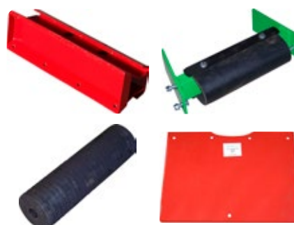
Kit arbres jeunes pour récolteuse RT 65