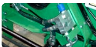
Kit de régulation de débit pour las vis sans fin de déchargement

*Uniquement pour tracteur avec débit d'huile supérieur à 60 L/mn sans possibilité de régulation