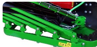
Différence de prix pour parapluie ouverture/fermeture basse sur RT 65 (prix pour montage d'origine à l'usine)