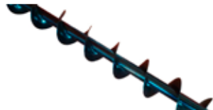
Kit sans fins pour remplacer les écaleses